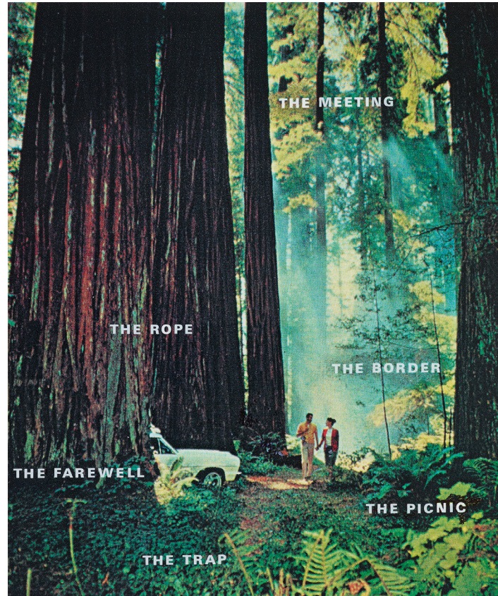
Plaatsbepaling/Positioning/Ortung. Frans Oosterhof, 1994. Bild mit analogen Haftbuchstaben.