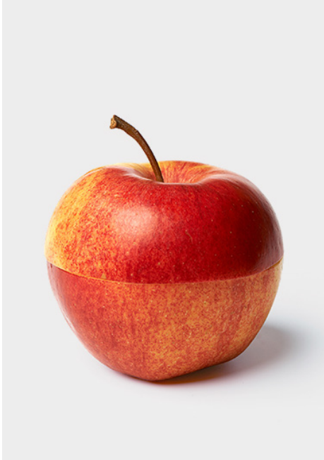
Aspektsehen, Tine Melzer, 2017.